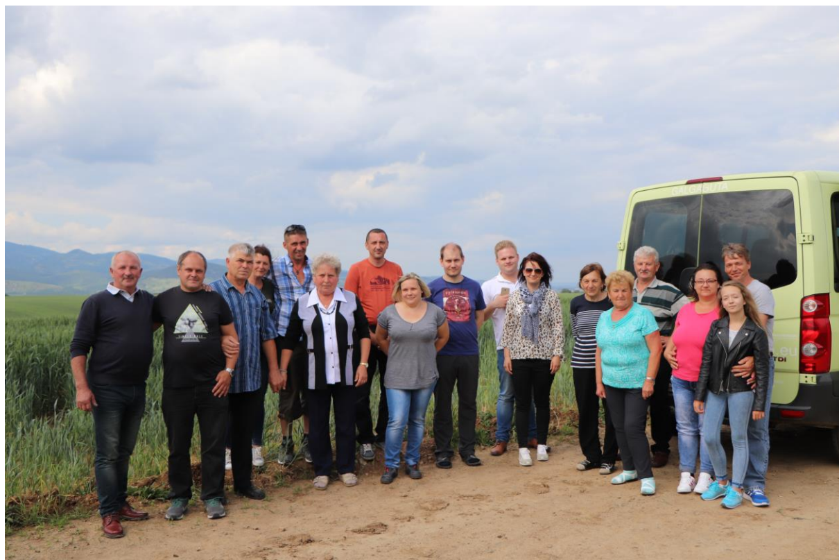
Útközben.... kis kerülővel a GPS miatt...

A pályázat fő célja az volt, hogy Szécsénke és Kénos települések között a tavalyi évben megkötésre kerülő testvértelepülési kapcsolat erősödjön, s több szálon keresztül kötődjenek a két falu lakosai egymáshoz. Ezen cél megvalósulásának úgy gondoltuk, jó alapja lehet a csíksomlyói búcsú, ami - a vallási vonatkozásán túl - a magyar emberek nagy találkozási pontja is.