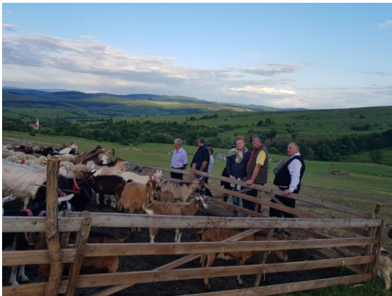
A dolgos kénosiak

Igazán jó érzés volt, hogy minden porta nyitva állt a szécsénkeiek előtt. S így igazán otthon érezhettük magunkat. Nem sajnálták ránk az időt, pedig mindenkinek volt dolga, hiszen az állatok ellátásában nincs ünnepnap. Az állatok tartásába is betekintést nyertünk. Kilátogattunk az esztenákra is.