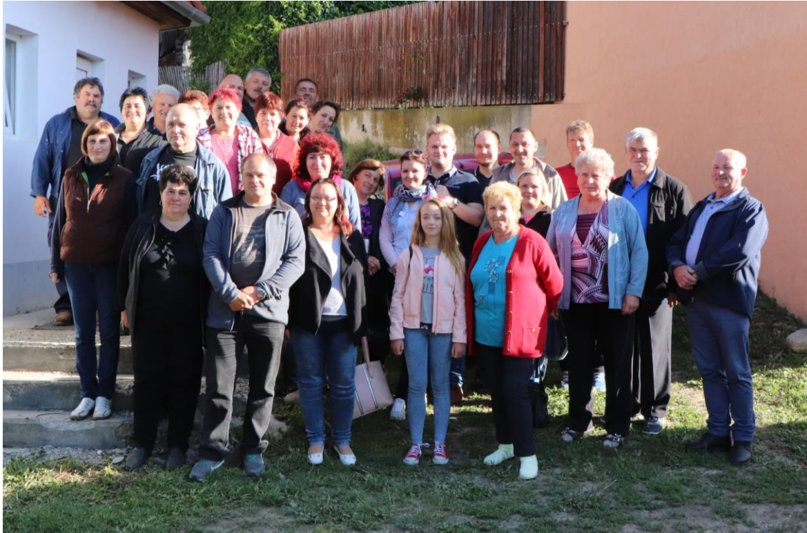
Magyar a magyarral

Hétfő reggel (május 21-én) nehéz szívvel elköszöntünk testvértelepülésünkötől, és hazafele indultunk. A hosszú úton a szécsénkeiek nem győzték méltatni a kénosiak vendégszeretetét, kitartását munkájukban és magyarságukban.