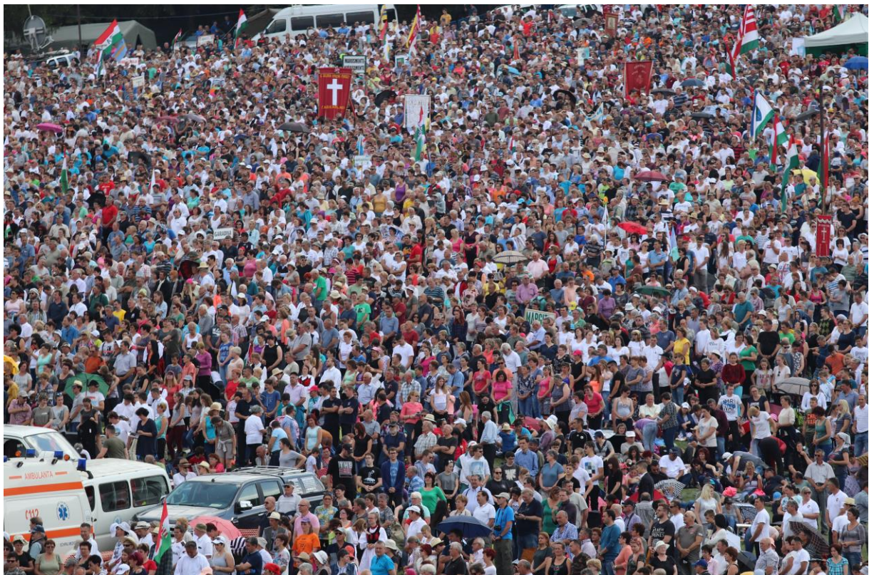
Ilyen sokan voltunk...

Megvalósult a Magyar Kormány támogatásával