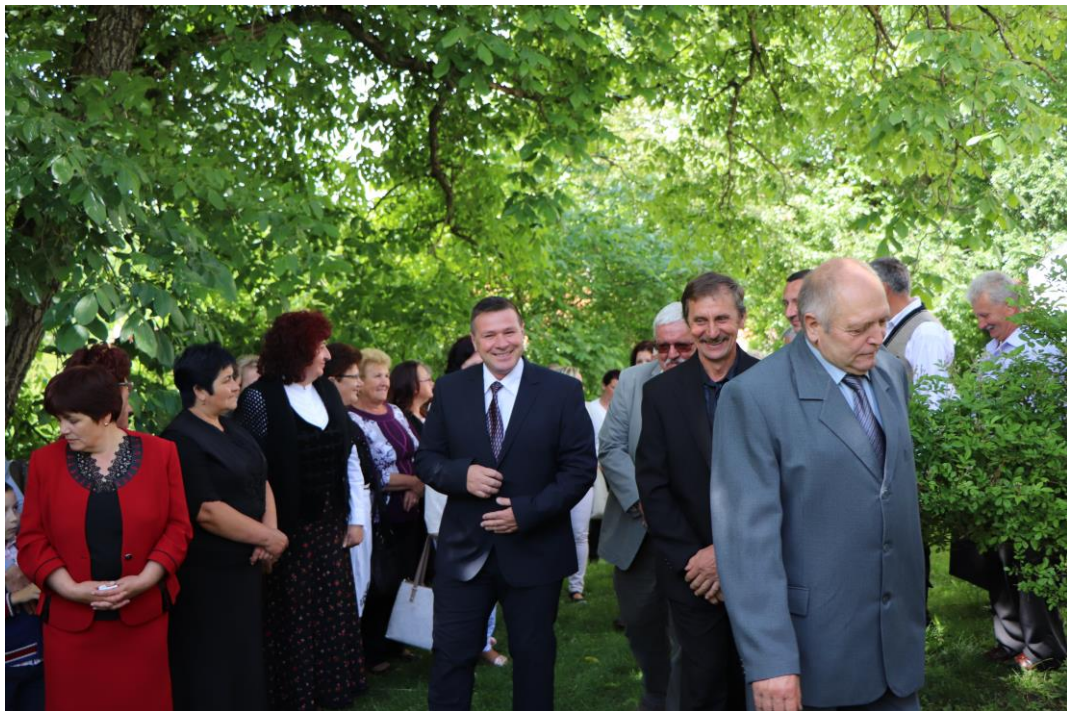
Nyomokat hagyunk az utókornak – kopjafa állítása

Megvalósult a Magyar Kormány támogatásával